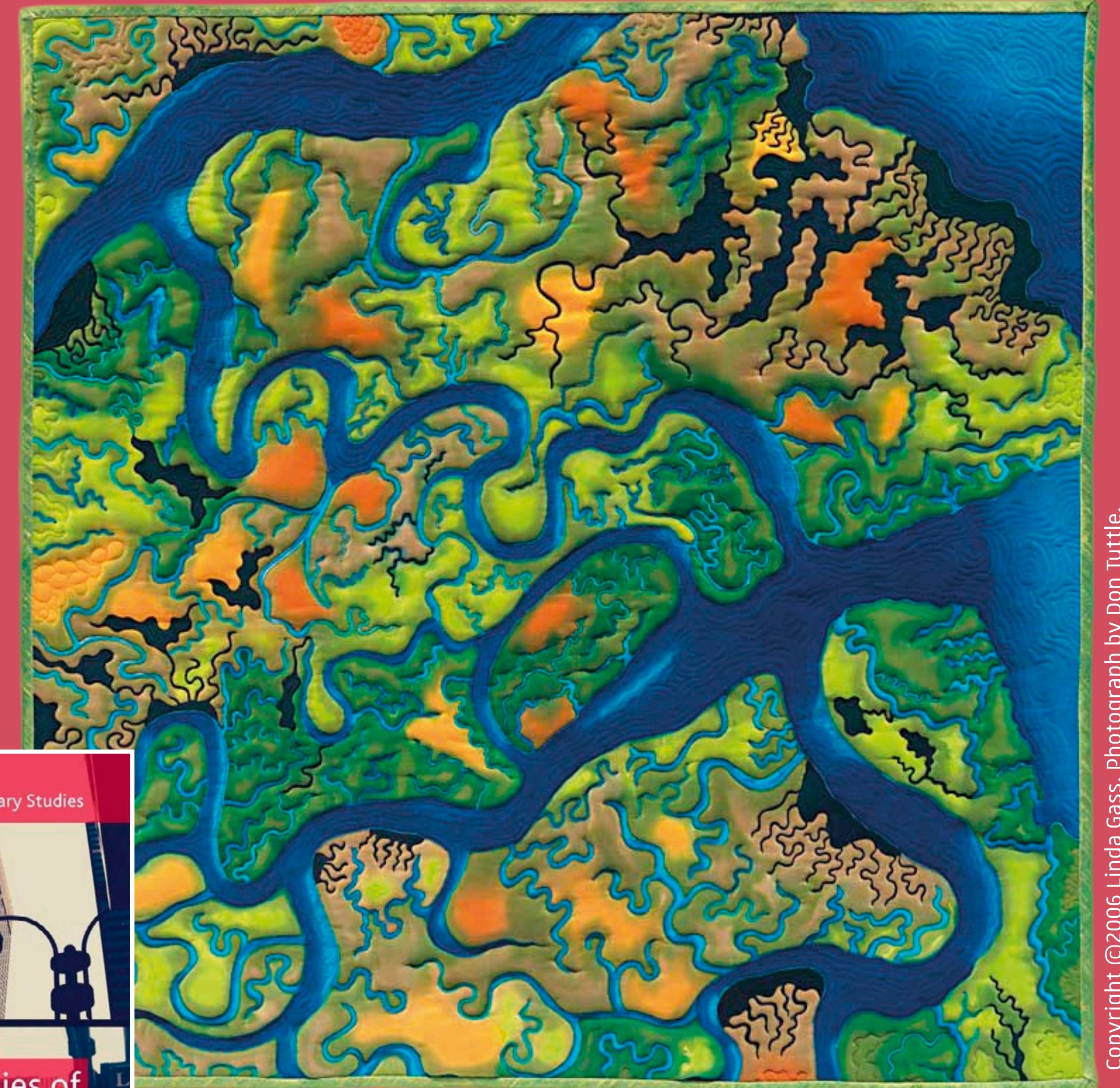
Linda Gass, Wetlands Dream , 2006.

Sa recherche traverse les frontières, tant au niveau des phénomènes étudiés que de l'approche déployée. Depuis une dizaine d'années, elle a élargi son domaine de recherche pour inclure l'art américain d'après 1960, motivée par la richesse de l'activité littéraire des artistes américains de cette période, qui combinent l'écriture de textes avec la création de sculptures, de performances et de cartes. Son projet de recherche actuel examine les liens qui unissent littérature et Land Art, un type d'art apparu à la fin des années 1960, dont les praticiens ont choisi de quitter les espaces institutionnels des musées pour créer des œuvres dans des lieux marginaux, en lien avec l'environnement, en adoptant une approche écologique pionnière.